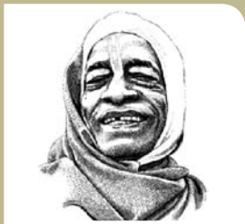
Ачарья-основатель Международного общества сознания Кришны А.Ч. Бхактиведанта Свами Прабхупада