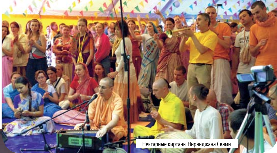
Нектарные киртаны Ниранджана Свами