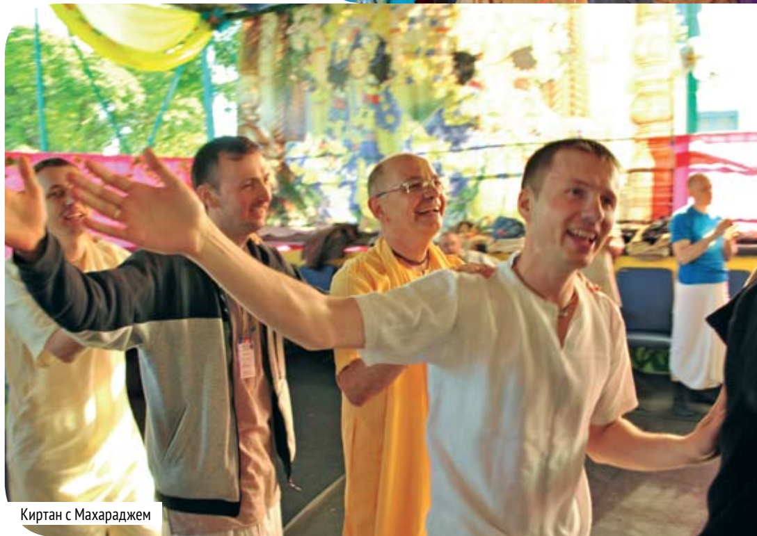
Киртан с Махараджем