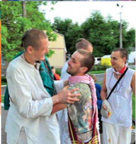
Радость встречи с вайшнавами