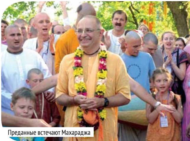
Преданные встречают Махараджа