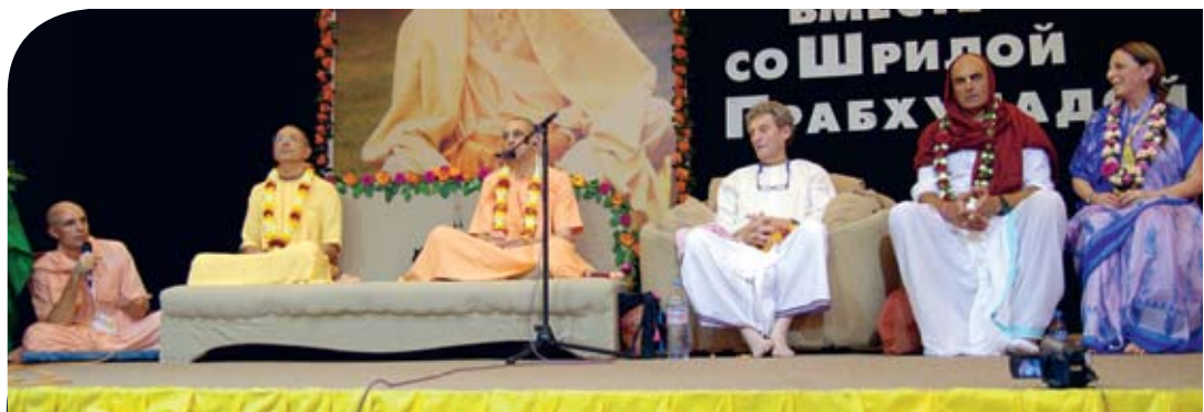
Торжественное открытие фестиваля