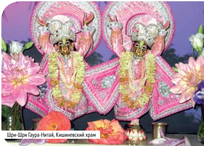
Шри-Шри Гаура-Нитай, Кишиневский храм

Интересно, что по заключенному договору мы продолжали получать продукты с молокозавода, а по поводу оплаты говорили примерно следующее: «Мы скоро сделаем перечисление.