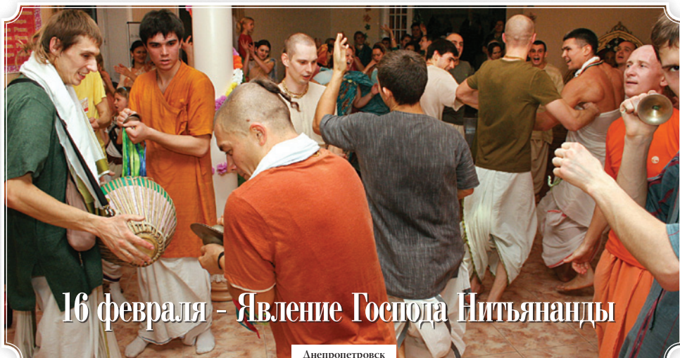
16 февраля - Явление Господа Нитьянанды