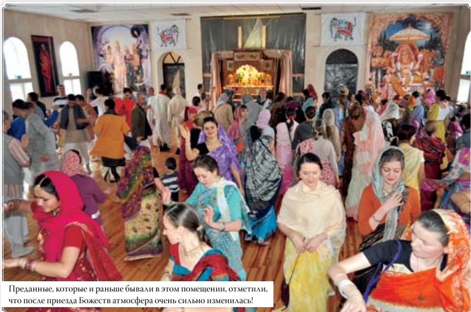
Преданные, которые и раньше бывали в этом помещении, отметили, что после приезда Божеств атмосфера очень сильно изменилась!