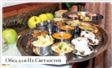
Обед для Их Светлостей

29 января, в благословенный день Экадаши, преданные харьковской ятры праздновали долгожданное событие. Их дорогие Гаура Нитай переехали в новый, с любовью построенный для Них большой храм.