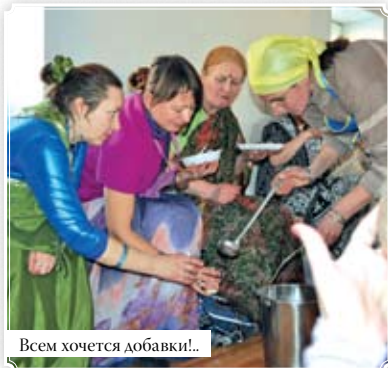
Всем хочется добавки!...