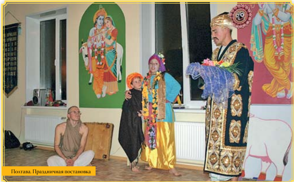
Полтава. Праздничная постановка