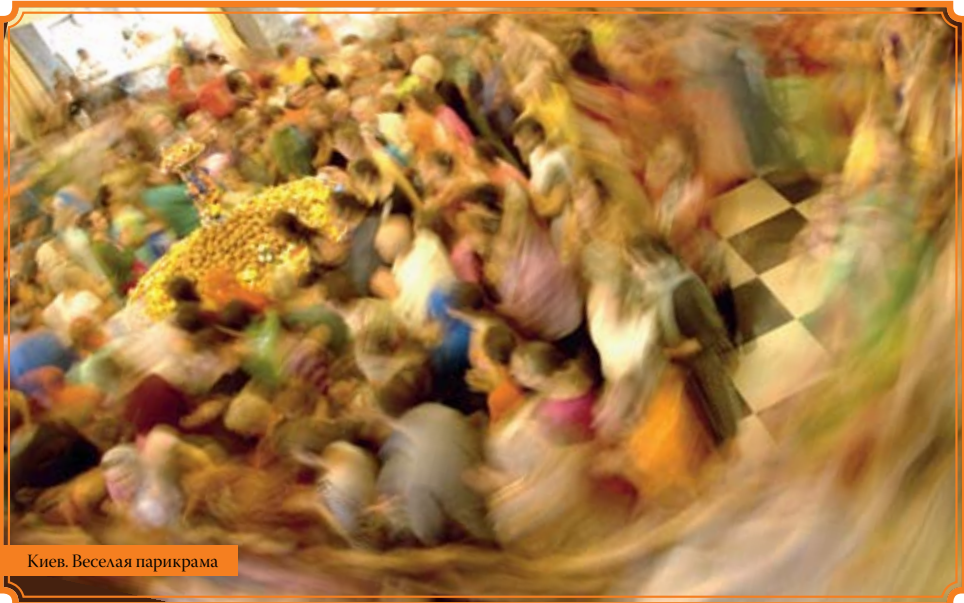
Киев. Веселая парикрама