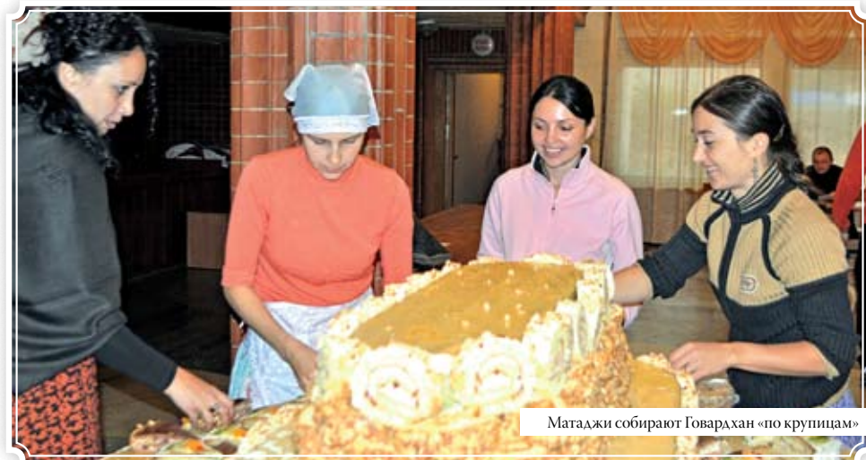
Матаджи собирают Говардхан «по крупницам»

Праздник «Сладкой горы» Говардхана-пуджа в Бельцах проводился впервые. Произошло это необыкновенное для жителей города событие 17 октября.