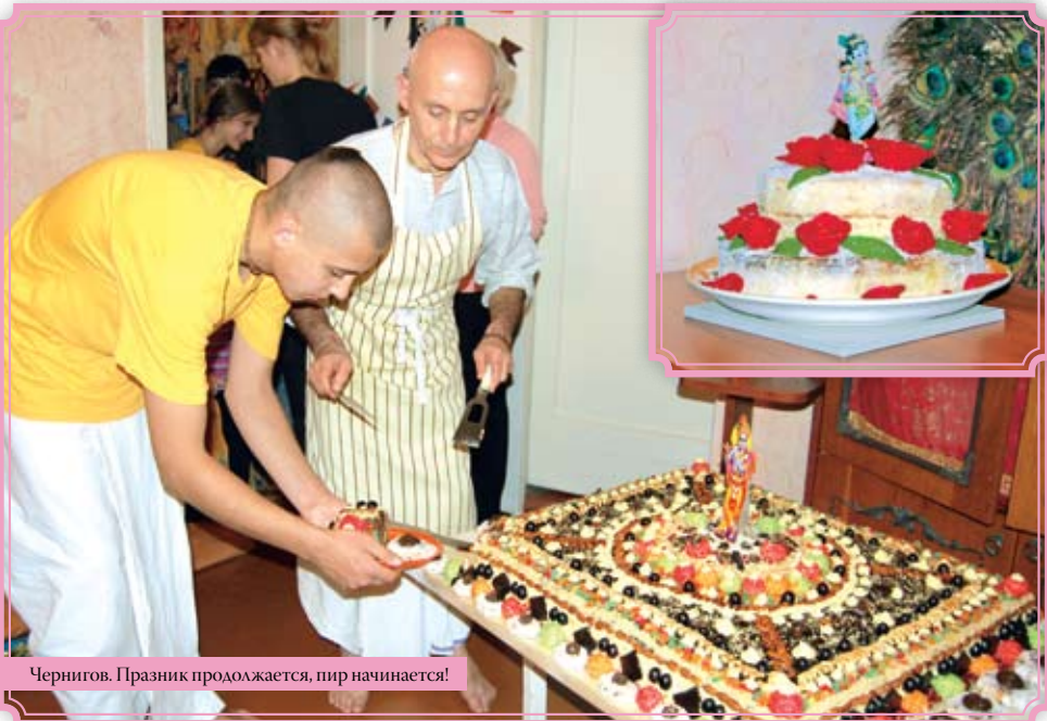
Чернигов. Праздник продолжается, пир начинается!