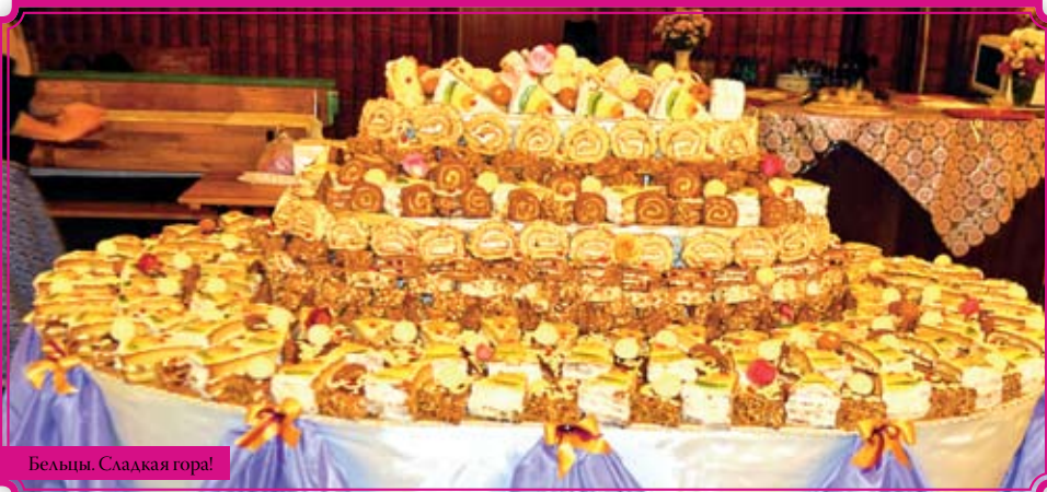
Бельцы. Сладкая гора!