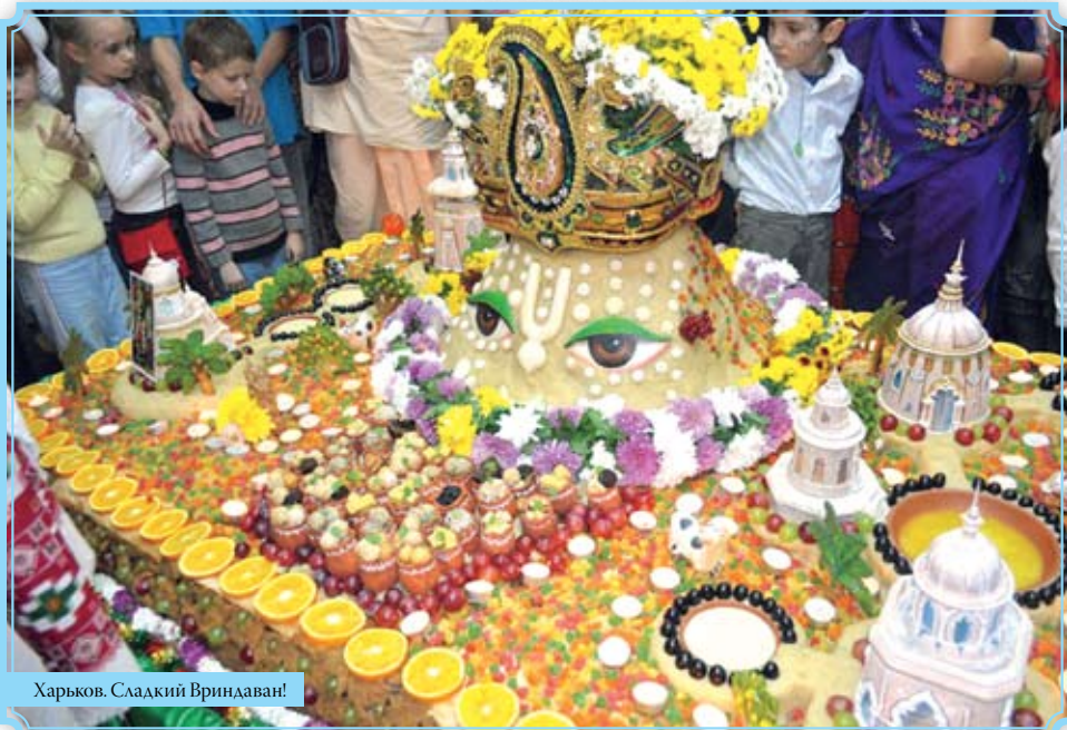
Харьков. Сладкий Вриндаван!