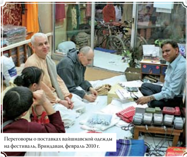
Переговоры о поставках вайшнавской одежды на фестиваль, Вриндаван, февраль 2010 г.