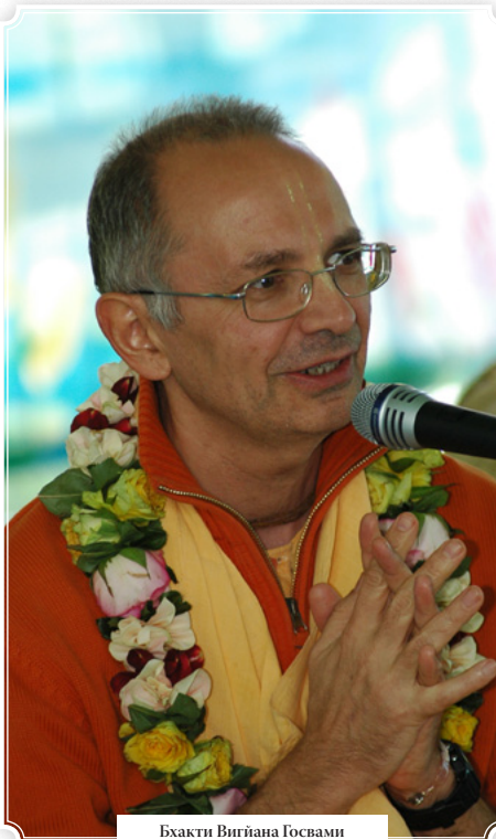
Бхакти Вигьяна Госвами

ность, и дхарма – это природа. Когда я осознаю, что я есть, что у меня есть природа, вместе с этим я признаю факт наличия у меня обязанностей. И, если я признаю факт наличия у меня