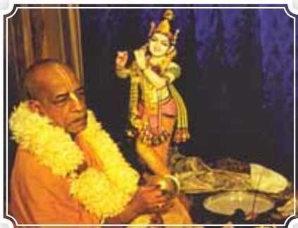
Лос Анджелес 23.06.1969

После Нью Вриндавана Шрила Прабхупада посетил центр в Лос-Анджелесе, где он установил Божества Кришны и Радхи. Хотя санкиртана является «главным фактором», как говорил Прабхупада преданным в Лондоне, поклонение Божествам является также не менее важным. В своих писаниях Прабхупада описывал необходимость поклонения Божествам, а также постепенно учреждал все более высокие стандарты поклонения в каждом из центров