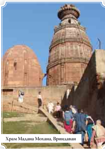
Храм Мадана Мохана, Вриндаван