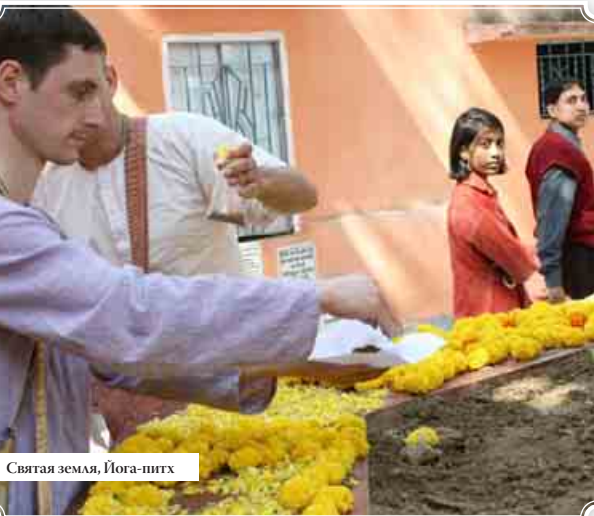
Святая земля, Йога-питх