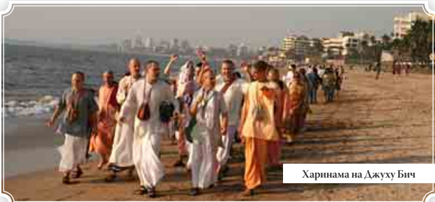
Хариinama на Джуху Бич