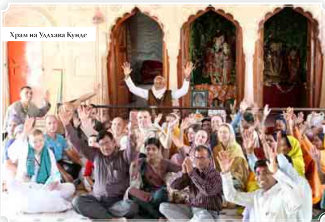
Храм на Удхава Кунде

павлины, аисты, цапли, слоны, попугаи, змеи. И все они как-то очень дружно уживаются с людьми. Индийцы относятся к животным очень терпеливо. Часто бывает, что коровы мешают дви-