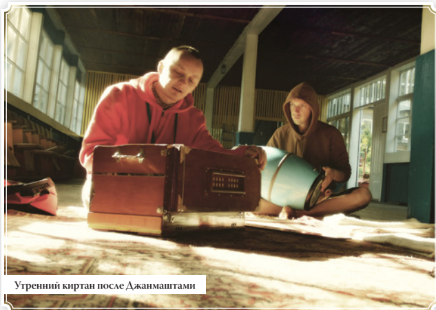
Утренний киртан после Джанманштами