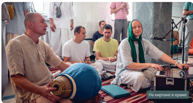
На киртане в храме

ному имени, так как не потратил деньги на себя и семью, а вложил их в строительство второго этажа в своем доме, чтобы принимать вайшнавов.